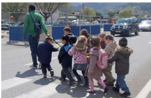
« Le serpent de marche » 1

Au Danemark en 1976, à Odense, le programme aller et retour sécuritaire pour l'école naissait en réaction à l'augmentation du nombre d'accidents graves sur le chemin de l'école. En 1997, les États-Unis lancent une journée « Marchons vers l'école », puis le Canada. Depuis, de plus en plus de villes proposent des autobus pédestres, appelés aussi pédibus , carapattes , millepattes , gross'trotter , dans le cadre de leurs plans de déplacements ou des agendas 21. Le principe : les enfants se tiennent par la main et sont guidés par un adulte qui suit un trajet et des horaires prédéfinis.