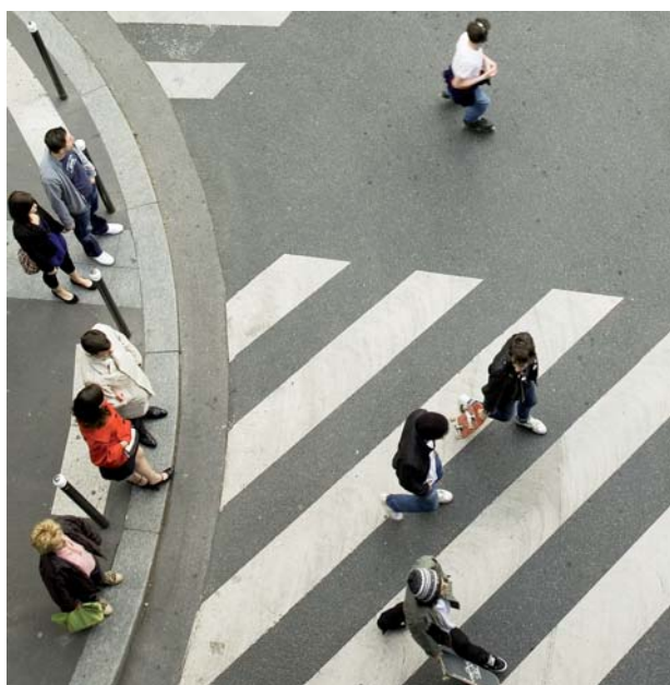
La marche, simple effet de mode ?

Son évidence a vite fait oublier qu'elle est un mode de déplacement à part entière. Or, le regain que connaît la marche aujourd'hui – suivi de manière attentive par les élus et les opérateurs de transport – peut servir de support à la réorganisation de toute la cité et ainsi de l'ensemble de la chaîne de mobilité.